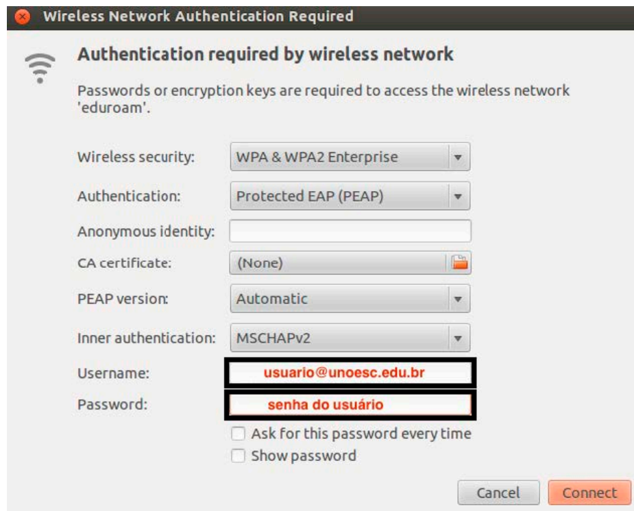
Figura 2 – Configurações para a rede eduroam.

Após clicar em Connect , uma janela aparecerá avisando-lhe que a conexão pode não ser segura devido à ausência de um certificado digital. Ignore o aviso. A conexão à rede eduroam deverá ser estabelecida com sucesso.