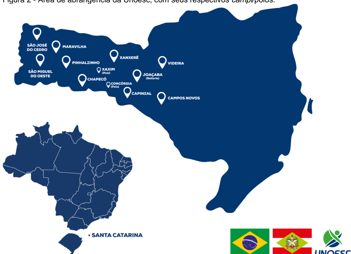
Figura 2 - Área de abrangência da Unoesc, com seus respectivos campi /polos.