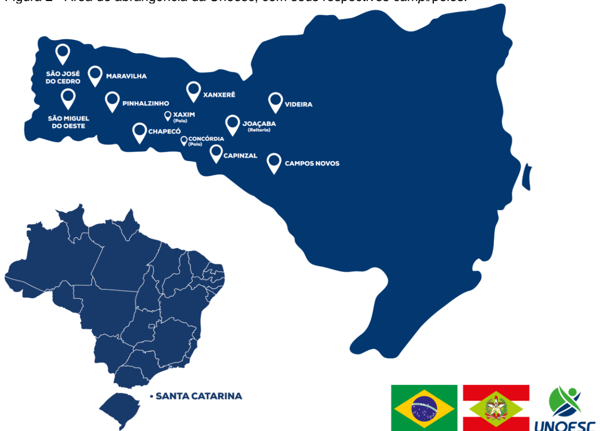
Figura 2 - Área de abrangência da Unoesc, com seus respectivos campi/polos.